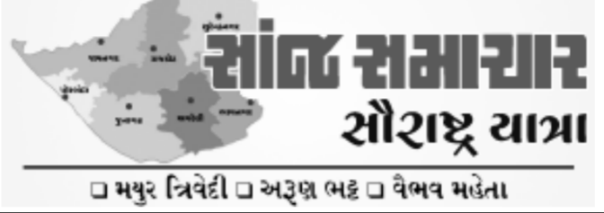
સાંજ સમાચાર સૌરાષ્ટ્ર યાત્રા

કોંગ્રેસના ધારાસભ્ય અને પાલિકામાં ભાજપની સત્તા; વિકાસના કામો કેમ થાય? સુવિધાના અભાવે ગ્રામજનોની હિજરત; ત્રણ સોલવન્ટ પ્લાન્ટમાં અલીગઢી તાળા